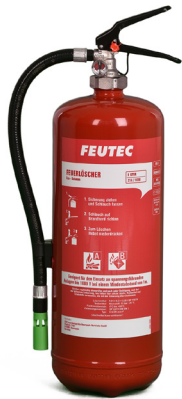
S 6 DN eco-P FEUTEC